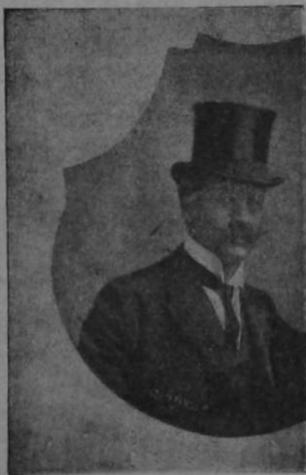
Sr. don Gustavo Pradilla Cónsul General de Colombia en Costa Rica

EL NOTICIERO se complace en presentar su atento saludo al señor Cónsul de Colombia en Costa Rica, el caballero don Gustavo Pradilla con motivo de la independencia de la hidalga República sud-ameridana, por él tan dignamente representada, y el que hacemos extensivo a la honorable colonia colombiana residente en el país.